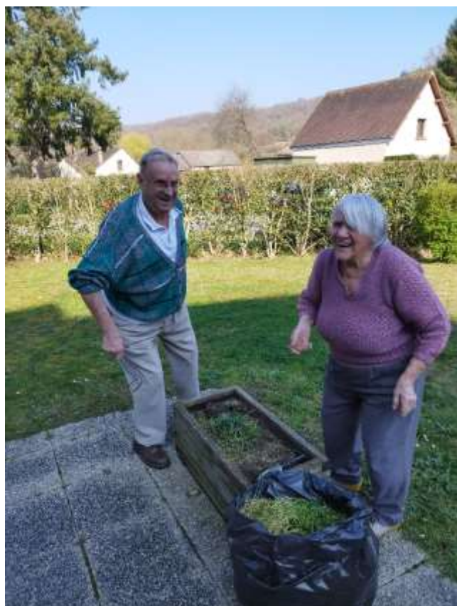
Atelier jardinage avec l'ergothérapeute